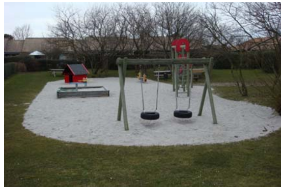
Efter renovering ☺

Udskiftning af faldunderlag på de to resterende legepladser (lille legeplads ved Rypevænget samt den store legeplads ved NEM købmanden) påbegyndes d. 25. maj af foreningens gartner J. W. Petersen.