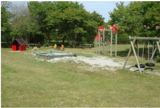
Før renovering ☺

Renovering samt udskiftning af faldunderlag på legepladsen ved Drosselvænget blev udført i efteråret 2008. Med et meget flot resultat som det kan ses af billederne herunder!