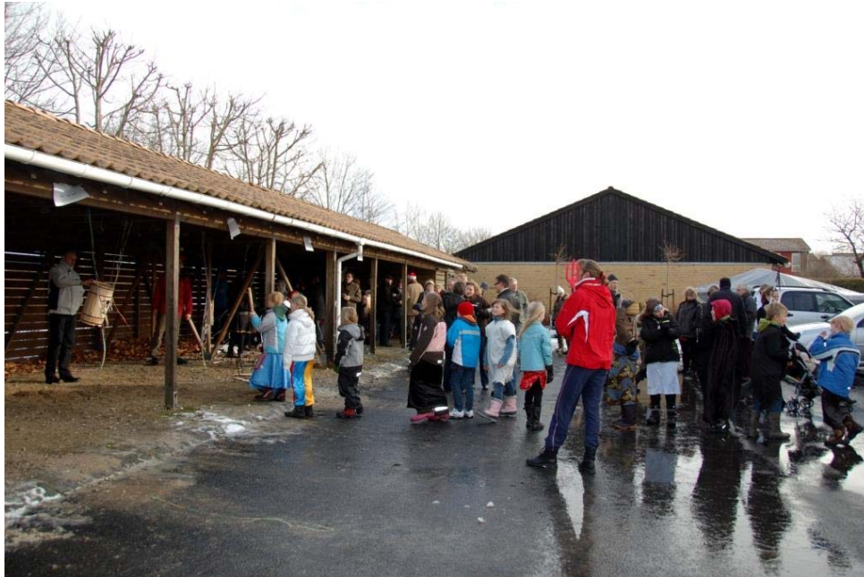
Fastelavns-hygge på Drosselvænget

Sammen med det dejlige forår følger endnu en udgave af "Ulleroden".