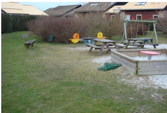
Legeplads ved Rypevænget

Det eksisterende sand og græs graves af og erstattes med certificeret faldsand. Forud for renoveringen er grundejerforeningens medlemmer velkomne til at tage sand fra begge legepladser – dog med undtagelse af sandet som er i selve sandkasserne på legepladsen. Sandet kan evt. bruges på terrassen eller som jordforbedring af græsplænen.