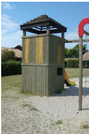
Legeplads ved NEM